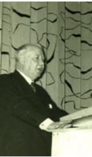
Landshövdingen Thorwald Bergkvist inviger nya Folkets Hus 1956.