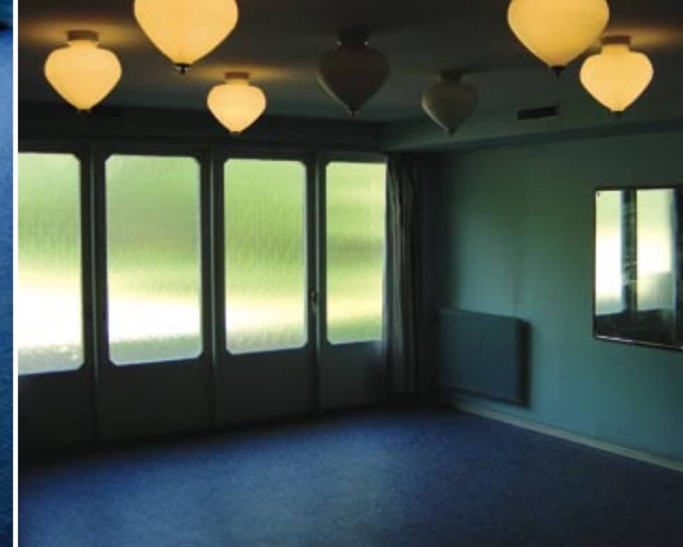
På Folkets Hus finns många ursprungliga detaljer kvar från 1950-talet, bl.a. den underbart blå glasmosaik från Kosta och taklamporna.

Det nya Folkets Hus fick en skiftande verksam-het med film och fester med artister som Owe Törnqvist och Nacka Skoglund. Man hade bingo, föreningsverksamhet och teater mm.