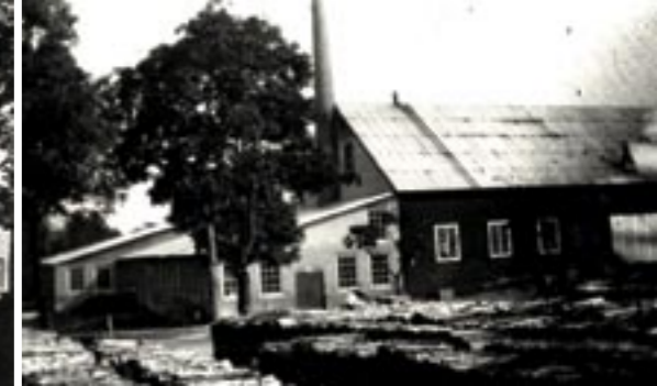
Nya sliperiet byggdes 1922 intill hyttan. Vedupplag i förgrunden. Bilden tagen från nuvarande caféet.