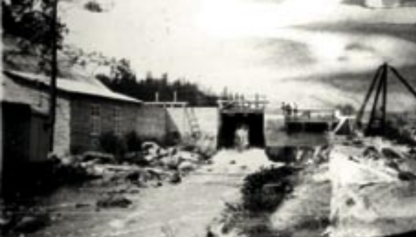
Den nyanlagda kraftstationen, 1920-tal.