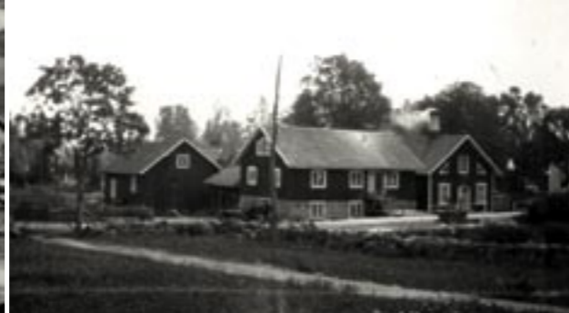
Kvarnen och sliperiet.

Åfors. Boda hade lyckats med sina olika aktiviteter bl a "Röda stugan" som blev en förebild för Åfors. Där såldes prima artiklar (som på den tiden inte fick säljas direkt vid bruken enligt en överenskommelse med återförsäljarna) I Åfors fanns bara en sekundbutik.