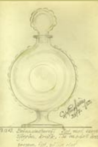
Skiss av Gustav Adolf Ringheim, 1952

Gunnel Sahlin anställdes 1989, och år 2000 också Olle Brozén. Du kan se deras glas i både shoppen, utställningshallen och Fina stugan.