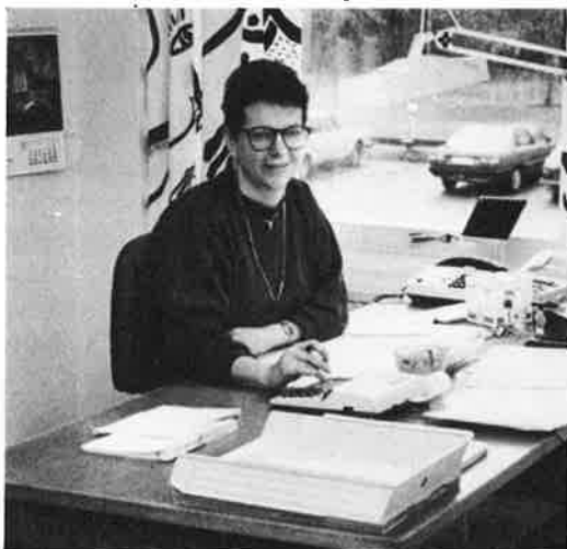
"Vid skrivbordet".