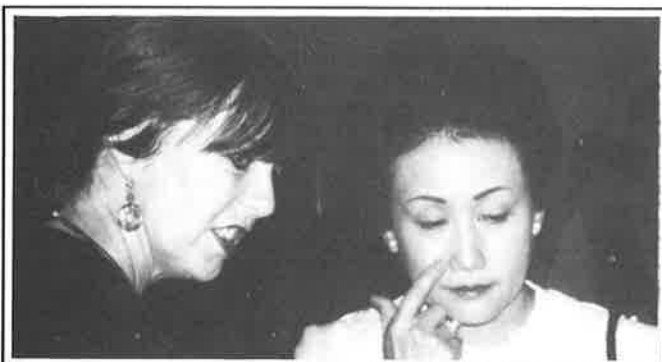
Prinsessan Hitachi betraktar ett av Ulricas verk (utanför bild). Ulrica förklarar tanken bakom.

Jubileumsutställningen visades också i ett kort inslag i "Sunday Museum" i NHK-TV.