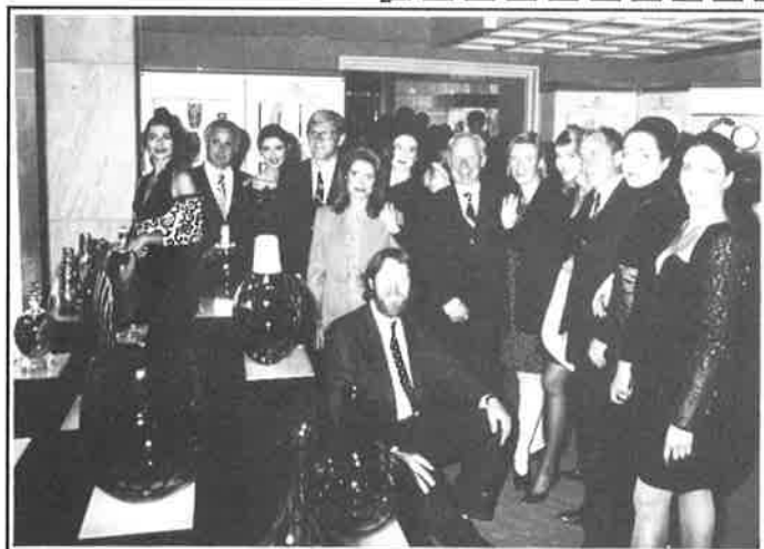
"Jubileumskalaset" i Aten

Trots att man inte hade räknat med någon försäljning, denna festkväll, såldes åtta av de utställda bitarna.