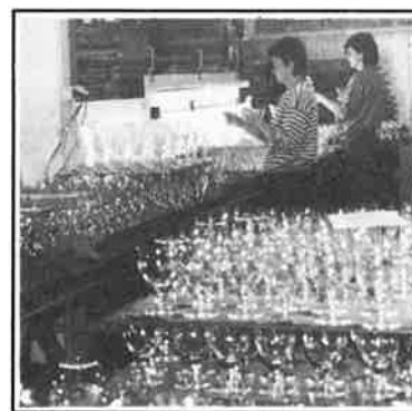
Glas på rullbanorna, på väg till syning

Signeringen sker också med teknikens hjälp. Här blåstras Orrefors logo på produkterna. Placeringen bestäms av den artikel man för tillfället signerar. På servisglasen placeras logon i botten, där benet och foten möts. Det märket sitter där för evigt, till skillnad från den traditionella etiketten, som man ju diskar bort ganska fort.