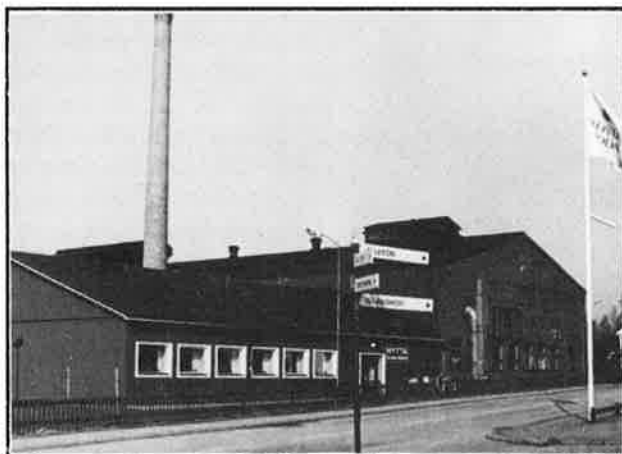
Bodas nya fasad, invigd 1990

Boda Nova och Boda Smide såldes på 70-talet och Boda Trä lades ner. Cirkeln var sluten och man koncentrerade sig åter på glaset.