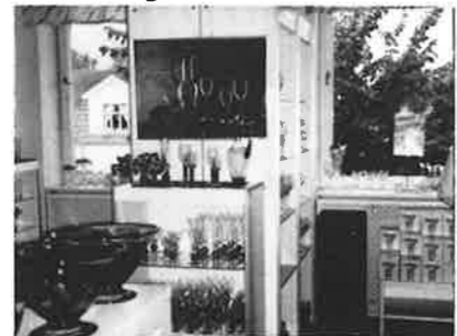
"Nobel" i Sandvikshopen

I Sandvik är det trångt i den lilla butiken. Servisglas, och framför allt "Nobel" har legat i topp hos kunderna, liksom det färgade glaset med "Louise" i spetsen. Man har haft mycket besökare, som också bjudits på glasblåsning "från balkongen" och kunnat förfriska sig i det lilla kaféets trevliga uteservering.