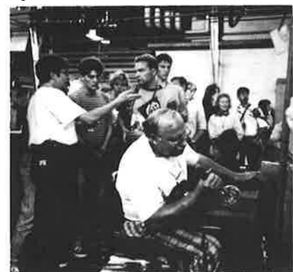
Guidetur i Kostahyttan