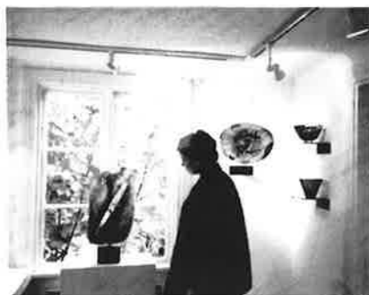
Betraktare av konstglas i Fina Stugan

På omvägar hör vi om en amerikan som handlade för 288 000 kr.