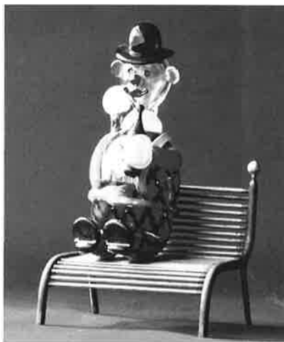
Clownen på bilden heter "Time for a beer"