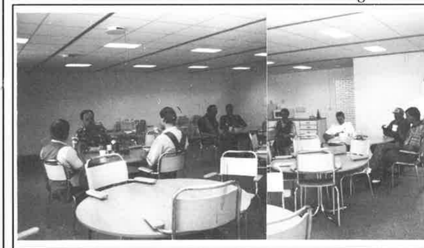
Fikapaus hos underhållsgänget. Lokalen passar också bra att använda vid utbildningar. ISO-grupper håller redan till här med sin utbildning.

Resultatet är ljusa och rymliga lokaler. Fyra kontorsarbetsplatser i ett rum, ett litet konferensrum, ett stort paus- och utbildningsrum, lokaler för underhåll, el, mek-verkstad, järnformverkstad och sprutlackering ryms i de nya lokalerna.