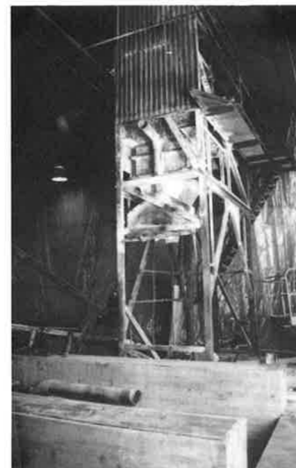
Vanna I fotograferad under rivningen. Bara mängtratten och fundamentet var kvar. Nu är allt rivet.

I Orrefors hade man till helt nyligen tre vannor. Nu är Vanna I, som byggdes 1975 ett minne blott. Under renoveringen av Vanna III, när man inte kunde producera, beslöt man sig för att utnyttja tiden till att riva Vanna I (som inte längre hade någon funktion) och att snygga upp runt denna. Rivningen har skett av vår egen personal. Frigjord yta används nu till skåp för ritningar, arbetsprover m m.