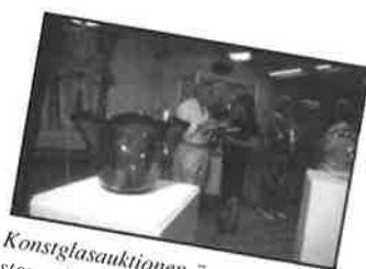
Konstglasauktionen är en av årets stora glashändelser i våra trakter.