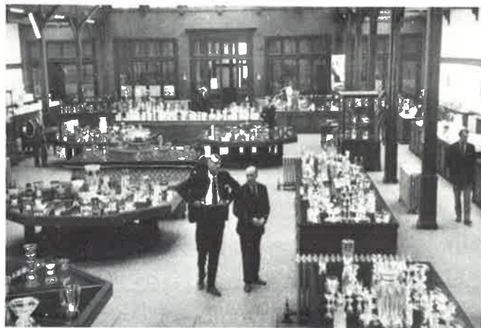
Utställningshallen hos Val S:t Lambert.

Onsdagen den 15 april besöktes glasbruket Val S:t Lambert i utkanten av Liege. Detta glasbruk är inrymt i ett mycket gammalt område som bland annat varit kloster en gång i tiden. Glasbruket har ca 1 200 anställda, varav 750 glasarbetare, vilka kör 3-skift i hyttan.